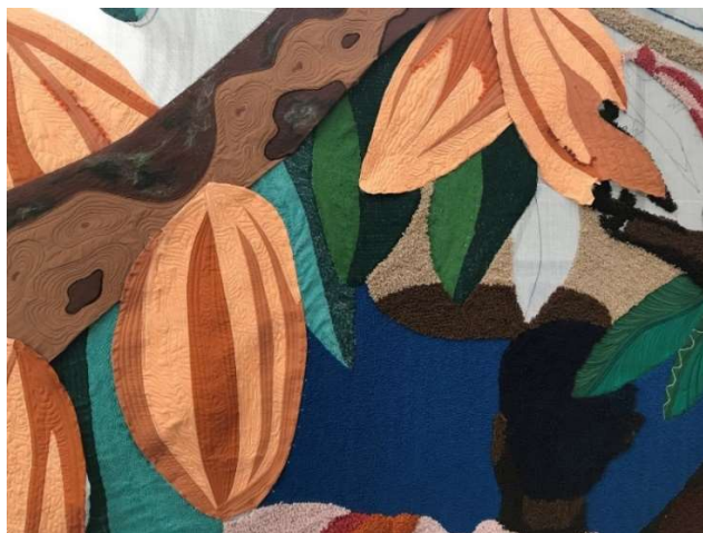
videoverslagen Groningse draden uit het koloniale verleden