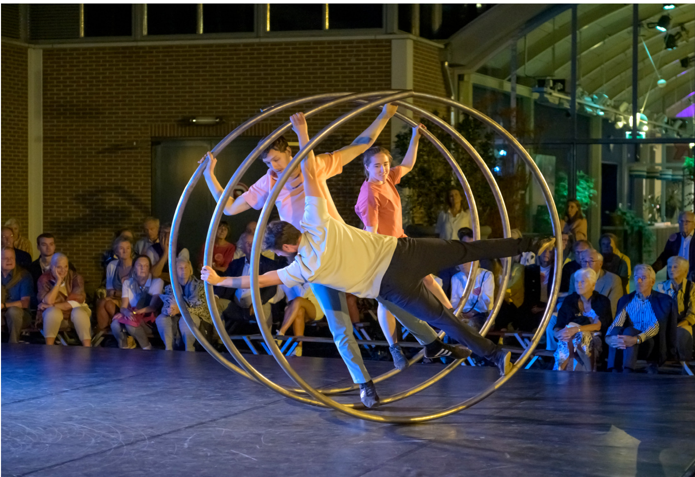
TeaTime Company tijdens Trails and Traces

Programmeurs van podia en festivals in binnen- en buitenland zullen zich bij House of Panama op de hoogte kunnen stellen van de laatste ontwikkelingen op het gebied van circus/dans. Professionals in de dans en het circus zullen door House of Panama uitgenodigd en uitgedaagd worden om kennis te delen en inzichten te ontwikkelen die het genre verder brengen. Daarin nemen we (nu al) een leidende rol. Op die manier strekt de werking van House of Panama zich ook uit naar andere gezelschappen en makers én naar nieuwe speelplekken in binnen- en buitenland.