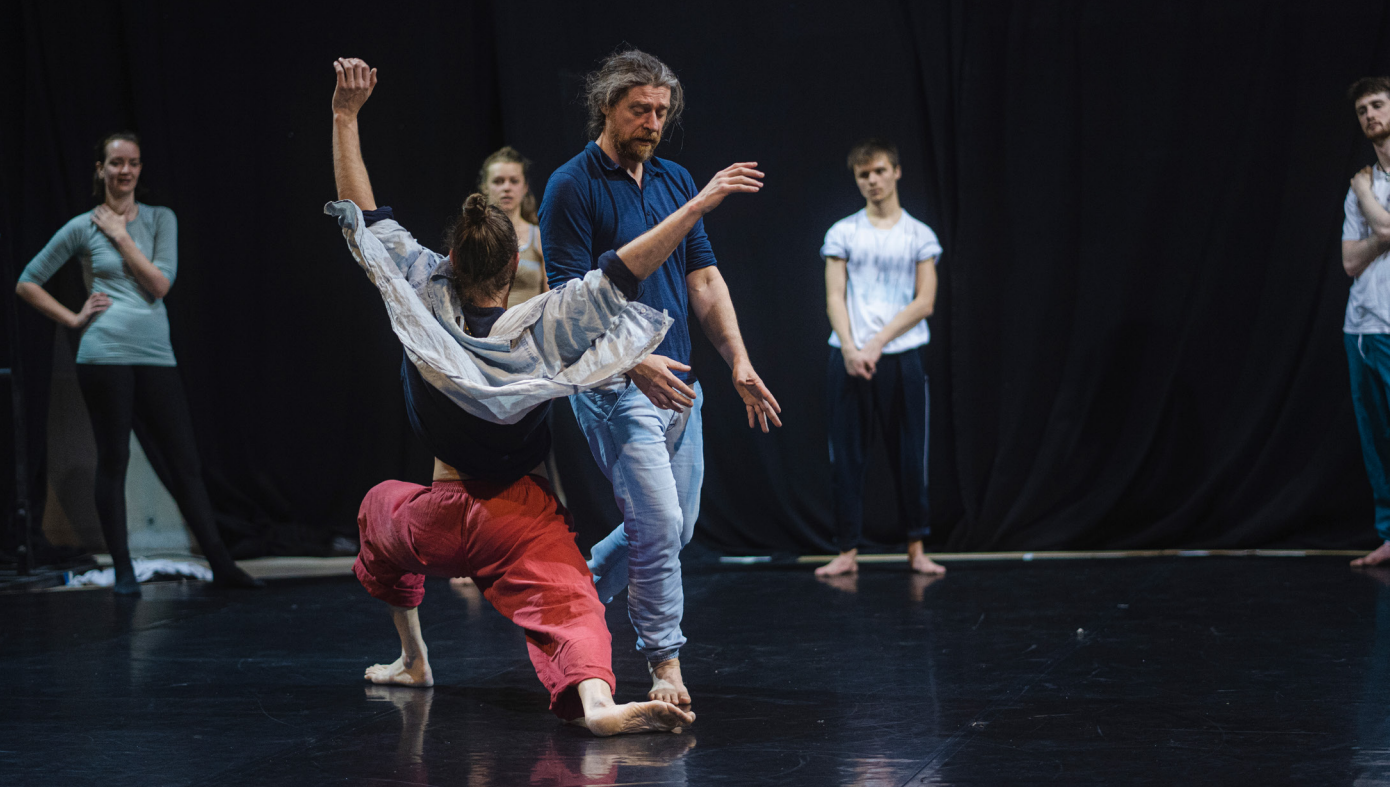
Workshop Panama Pictures

Dat doen we in 2023 en 2024 aan de hand van de volgende onderzoeksvragen: