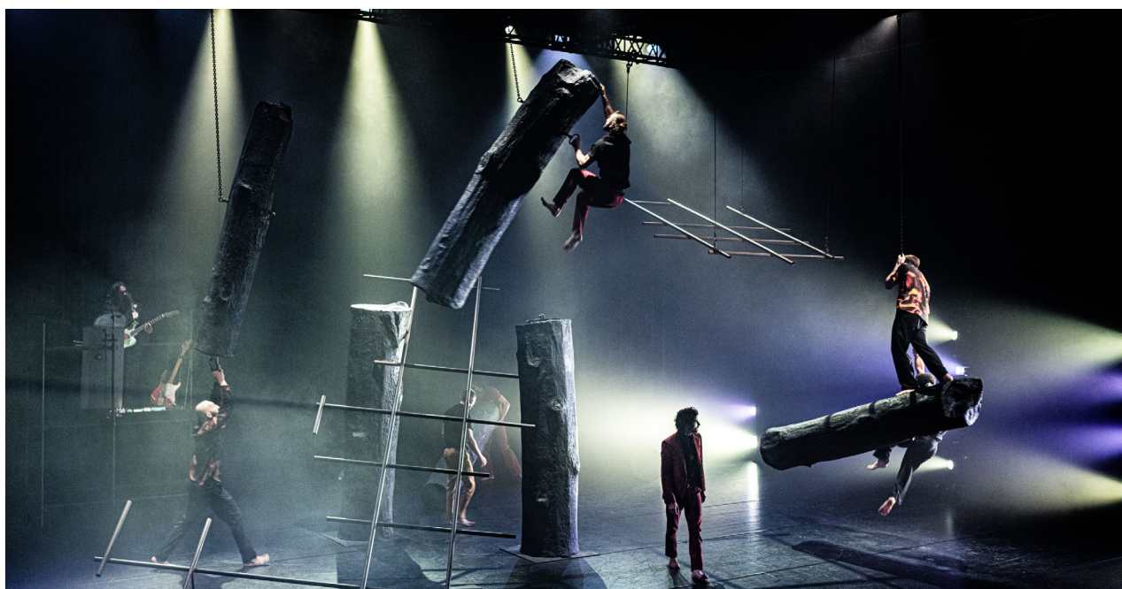
The Man who fell from the sky, Panama Pictures.

Continue verdieping, vernieuwing en verjonging in een dynamische omgeving; dat is wat House of Panama de sector straks te bieden heeft. House of Panama is en blijft gevestigd in 's-Hertogenbosch, met als belangrijke ankerplaats de studio en de werkplaatsen aan de Beverspijken. House of Panama zet van daaruit de deuren open naar de wereld.