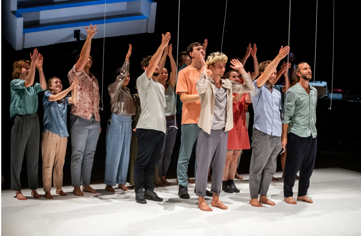
Trails and Traces