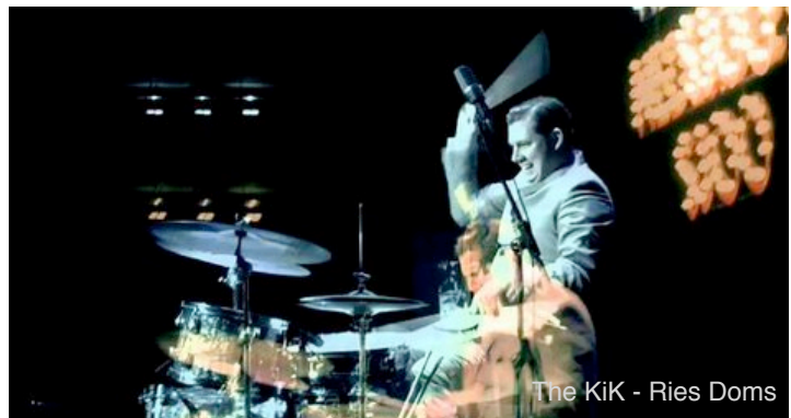
The KiK - Ries Doms